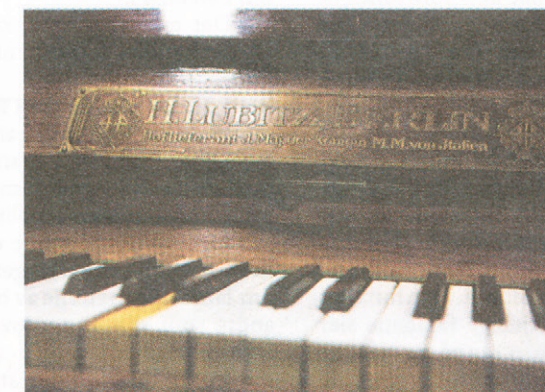
Velbrukt: Kunstneren har selv spilt på familiepia- noet i sju år. – En typisk borgerlig ungpiketradisjon.