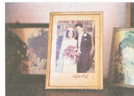
På utstilling: Familiebilder som inntil nylig har hengt over pianoet hjemme i Brevik.

– Nei, de er nok helt vanlige. Alle fami- lier har sine ting. Men virkelighe- ten er annerledes enn jeg trodde da jeg