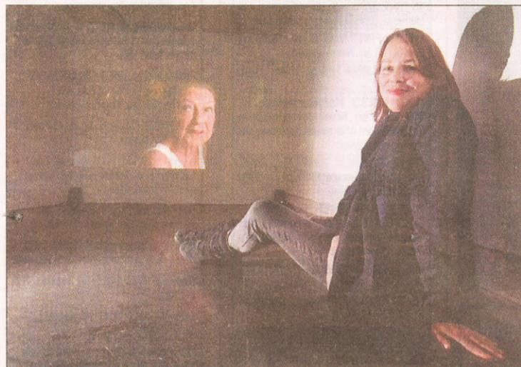
TANTE ASTRID: Den prisbelønte filmen om tante Astrid som i den alder av 70 år skal klippe håret for første gang er humoristisk, vemodig og talende.