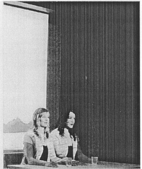
Valborg i Nyksund på Galleri 8439 5. juni i for.